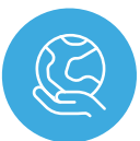
Cymru sy'n gyfrifol ar lefel byd-eang