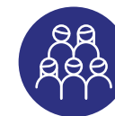
Cymru o gymunedau cydlynus