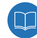
Cymru â diwylliant bywiog lle mae'r Gymraeg yn ffynnu