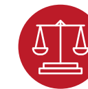
Cymru sy'n fwf cyfartal